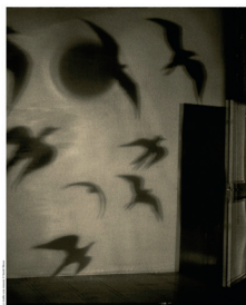
LE DÉSIR 23 e PRINTEMPS DES POÈTES du 13 au 29 MARS 2021 Soutenu par

(Programmation tenant compte des mesures en vigueur et faisant une large place aux événements numériques.)